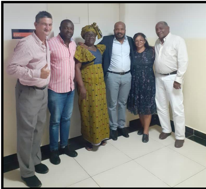
Os iniciadores da UÓR