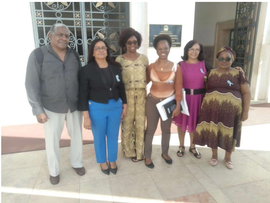
13. Segunda edição do programa Conexão de ajuda entre pares Outubro 2025